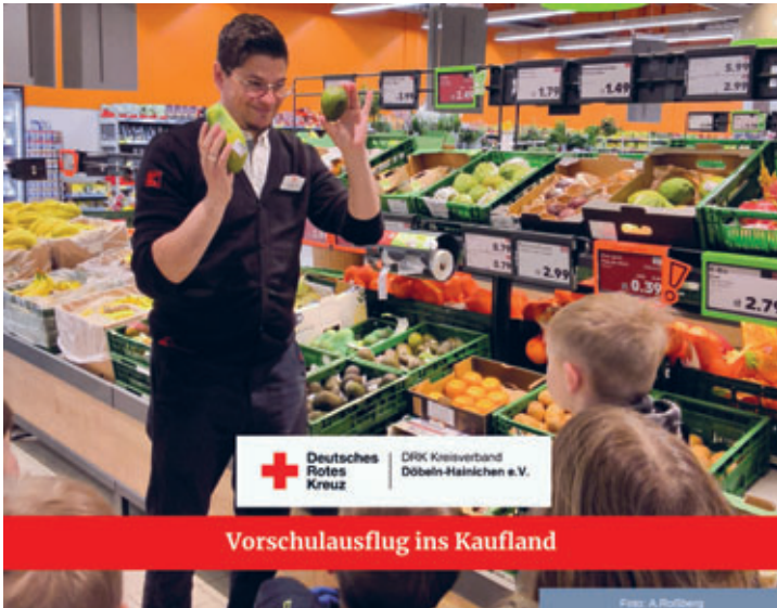
Vorschulflug ins Kaufland

Die Vorschüler der Kindertagesstätte „Märchenland“ waren in den letzten 4 Wochen ganz schön unterwegs.