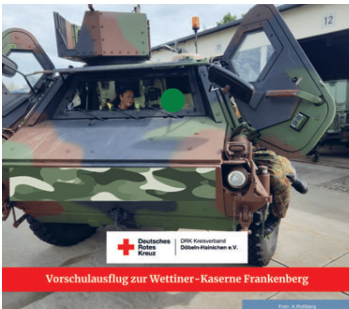
Vorschulflug zur Wettiner-Kaserne Frankenberg