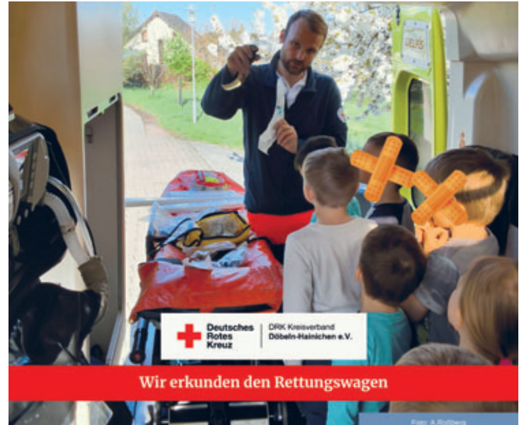
Wir erkunden den Rettungswagen