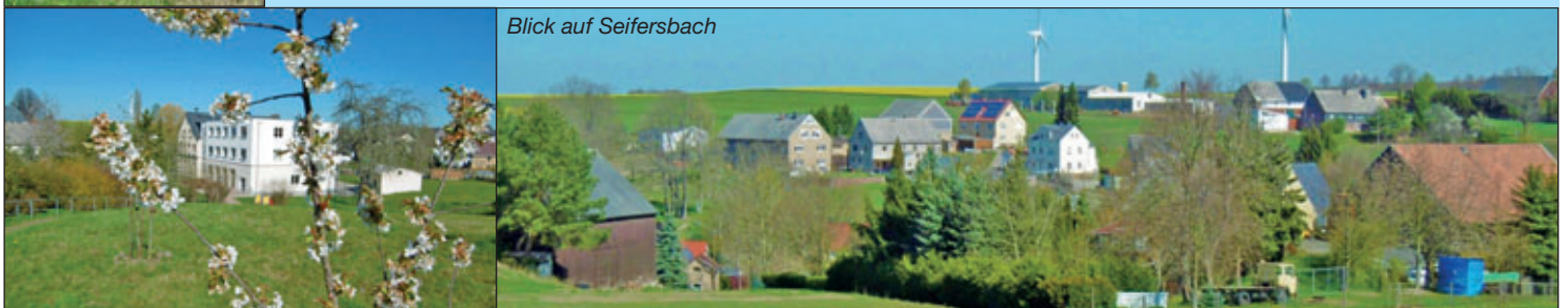
Blick auf Seifersbach

Ich hoffe auf eine baldige Besserung der Situation und damit die Rückkehr zu den alltäglichen sowie lieb gewonnenen Dingen und Gewohnheiten, die in den letzten Tagen nicht möglich waren.